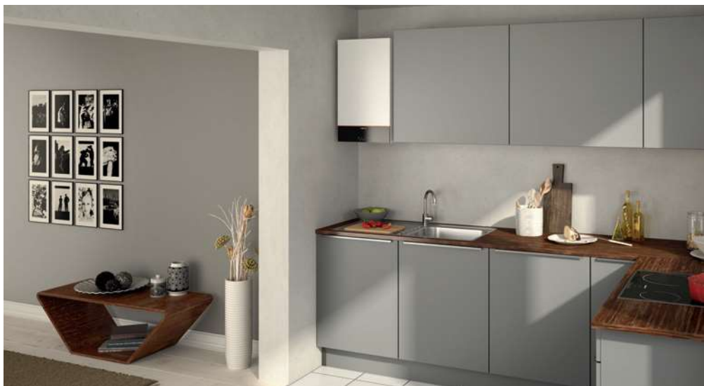
Vitodens 100-W v atraktívnom dizajne, farba Vitopearlwhite

Kompaktné a účinné nástenné plynové kondenzačné kotly s mimoriadne atraktívnym pomerom ceny a výkonu.