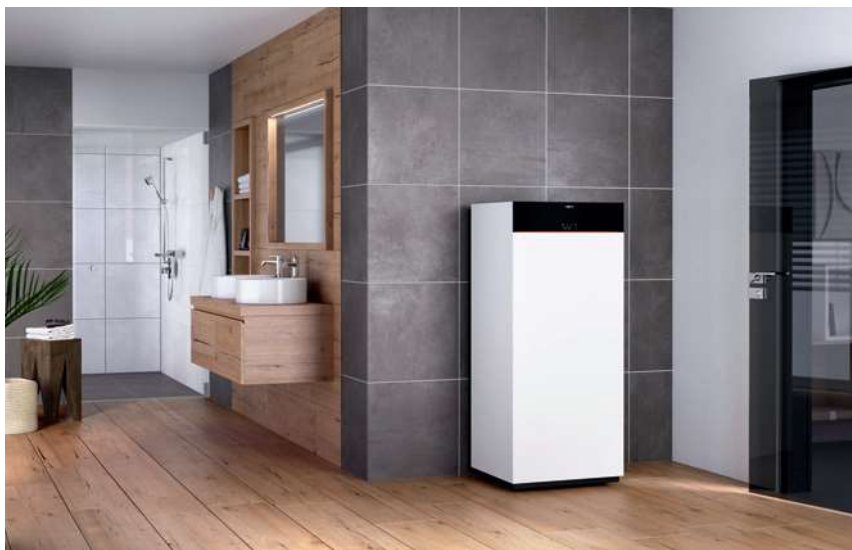
Vitodens 111-F s atraktívnym dizajnom vo farebnom prevedení Vitopearlwhite