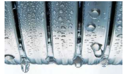
Výmenník tepla Inox-Radial

3,5-palcový 7 segmentový displej s dotykovým ovládaním novej elektronickej platformy sa vyznačuje veľmi jednoduchou a zrozumiteľnou obsluhou a decentným dizajnom v prevedení Blackpanel. Umožňuje veľmi komfortne nastavovať vykurovacie zariadenia s priamym a/alebo so zmiešaným vykurovacím okruhom.