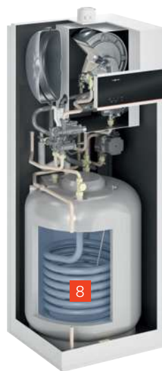
VITODENS 111-F (typ B1SF)