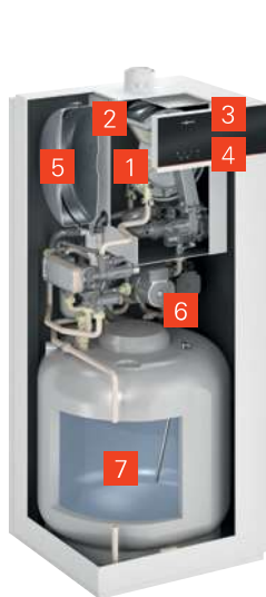
VITODENS 111-F (typ B1TF)