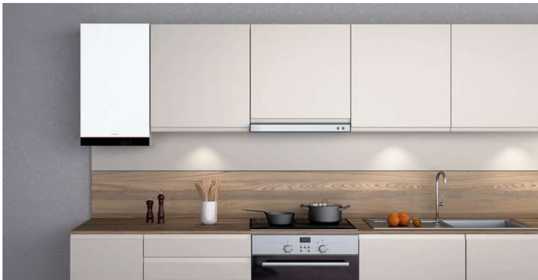
Vitodens 050-W v atraktívnom dizajne, farba Vitoppearlwhite

Kompaktné a efektívne nástenné plynové kondenzačné kotly s mimoriadne zaujímavým pomerom ceny a výkonu.