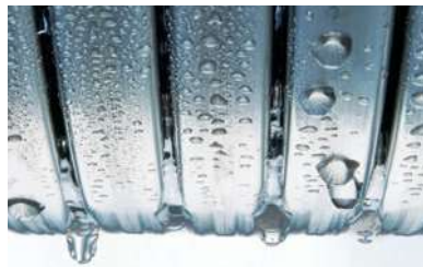
Výmenník tepla Inox-Radial

Rozdiel je vždy v nehrdzavejúcej oceli. Výmenník tepla z ušľachtilej nehrdzavejúcej ocele Inox-Radial odolný voči korózii je jadrom zariadenia Vitodens 050-W. Vloženú energiu zvlášť účinne premieňa na teplo s istotou kvalitnej ušľachtilej ocele s mimoriadne dlhou životnosťou.