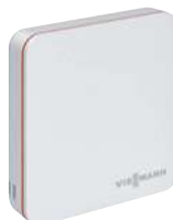
Termostat ViCare pre vyšší komfort a účinnosť

Pripojenie vysokokvalitného termostatu ViCare vyvinutého na použitie s vykurovacími systémami Viessmann umožňuje pohodlné regulovanie teploty miestnosti prostredníctvom aplikácie. Teplota kotla sa okrem toho automaticky prispôsobuje požiadavkám na teplo, čo šetrí energiu a zvyšuje čas životnosti.