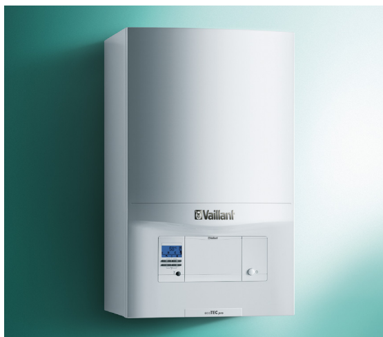
Závesný plynový kotol ecoTEC pro