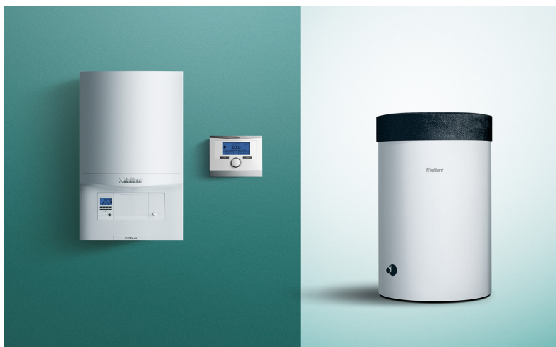
Kotol ecoTEC pro, regulátor calorMATIC 450, zásobník uniSTOR VIH 120